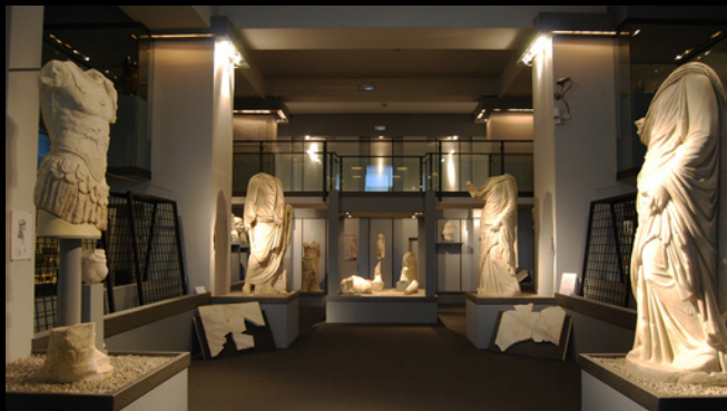
MUSEO ARCHEOLOGICO REGIONALE DI CENTURIFE